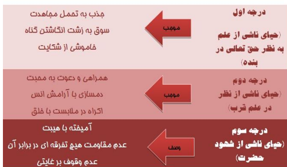
شکل ۴. حیا

دیدن این که خدا می‌بیند صحبت می‌شود یک چیز خاص تر است. چون اینجا مخاطب قرآن عام بوده و قدمی در مسیر قرب الی الله نداشته تعبیر علم به کار رفته چون علم یک حالت عامی دارد و فطرتاً این علم را همه دارند هر چند از آن غافل شوند. تفاوت ذوق