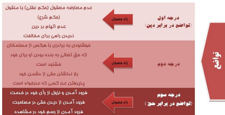
شکل ۸. تواضع

«وَ اخْفِضْ جَنَاحَكَ لِمَنِ اتَّبَعَكَ مِنَ الْمُؤْمِنِينَ وَ قُلْ لَهُمْ قَوْلًا مِّسُورًا»