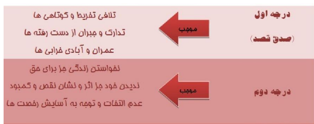
شکل ۵. صدق

«وَجَعَلْنَا لَهُمْ لِسَانَ صِدْقٍ عَلِيًّا» (مریم/۵۰) راستی و صداقت نزدیکترین راه برای رسیدن به هدف است و کسی که در راه مستقیم سیر کند کامیاب‌ترین افراد در راه رسیدن به مقصد خواهد بود.