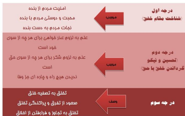
شکل ۷. خلق

«أَحْسَنَ كَمَا أَحْسَنَ اللَّهُ إِلَيْكَ» (القصص/ ۷۷)