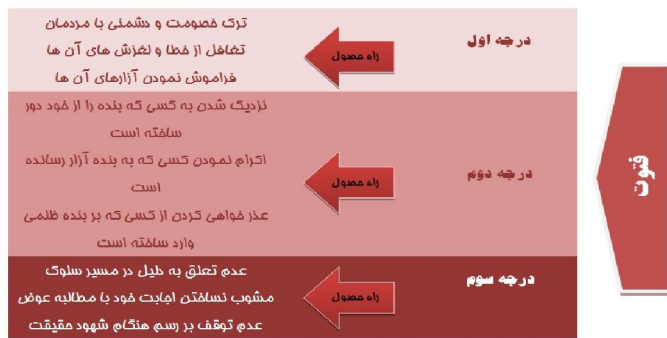
شکل ۹. فتوت

۱-۱۰-۲- برخی شواهد قرآنی مرتبط به مفهوم فتوت در منزل سی و نهم: «وَالكَافِرِينَ الْغَيْظُ وَالْعَافِينَ عَنِ النَّاسِ وَاللَّهُ يُحِبُّ الْمُحْسِنِينَ»، «خَذَلْعَفُو وَ أَمْرٌ بِالْمَعْرُوفِ وَ أَعْرَضَ عَنِ الْجَاهِلِينَ». پیامبر صلی‌الله‌علیه‌وآله علاوه بر بخشش آنها باز به تربیتشان می‌پرداخت.